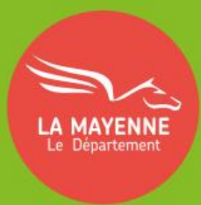
Schéma départemental des mobilités durables